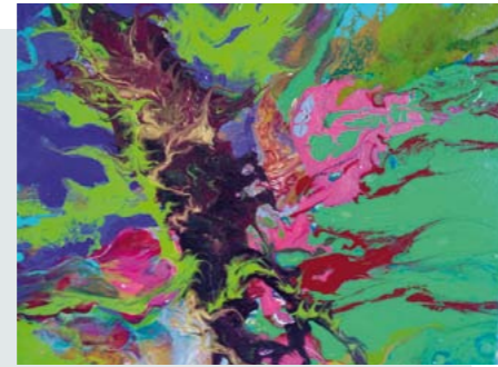
Isabel Maroto CONTRASTES Pintura